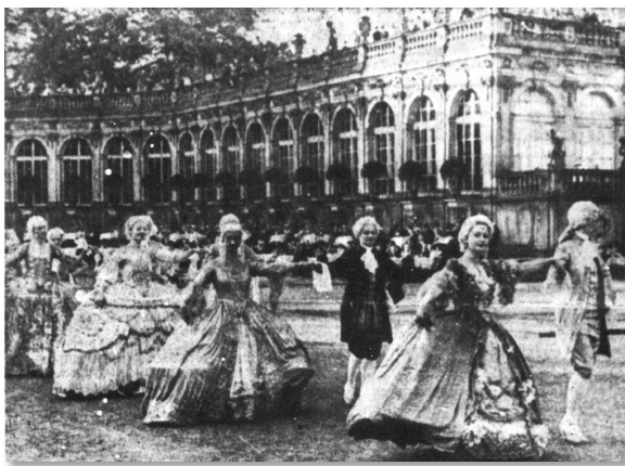
Abb. 3: Impressionen vom „Zwinger-Fest“, Juni 1939

Van Kempen ist sicherlich zunächst nicht bewusst, welches Arbeitspensum auf ihn und sein Orchester zukommt. Die Philharmonie spielt ab 1935 jeden Sonnabend, beginnend mit dem Auftakt zu Pfingsten, bis zum ersten Septemberwochenende eine Serenade. Das wäre für das Laienorchester des Mozart-Vereins nicht realisierbar. Deshalb sucht sich der Verein als Ersatz mehr oder weniger erfolgreich andere Spielorte (z.B. Stallhof und Hof des Residenzschlosses).